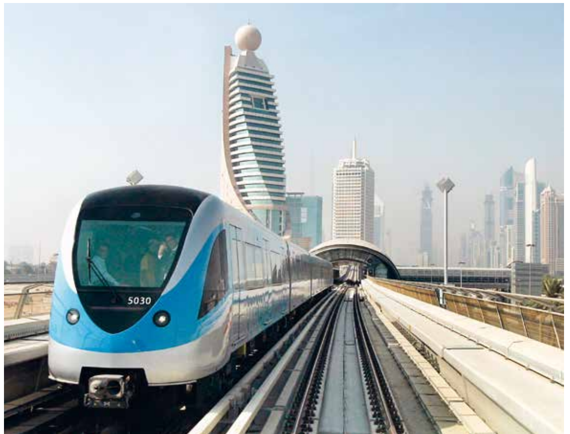
El metro de Dubai llegará hasta la Exposición Universal 2020. RTA

Además de este consorcio (Expo-link), otra alianza liderada por la constructora japonesa Obayashi