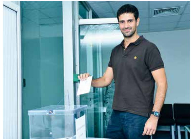
Español emite su voto en la Embajada de España en Abu Dhabi. M. K. ABBAS

En los países del Golfo numerosos españoles cumplieron con su deber y volvieron a votar el pa-