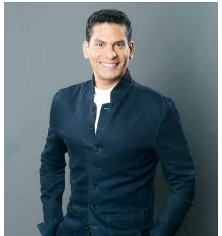
Ismael Cala, nuevo columnista de EL CORREO. EL CORREO

Actualmente es considerado uno de los comunicadores más importantes de América y su mensaje de emprendimiento social, ‘mindfulness’ y bienestar es referencia para millones de seguidores que siguen su obra en libros, seminarios, talleres y conferencias a lo largo de toda Hispanoamérica. Los lectores han recibido con entusiasmo la incorporación de Cala a EL CORREO DEL GOLFO.