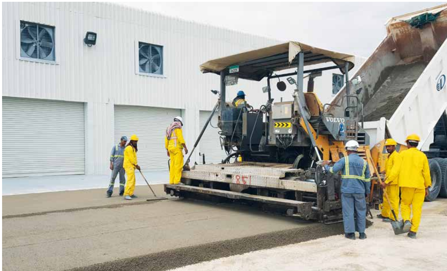
Proceso de pavimentación con la técnica de concreto compactado con rodillo llevado a cabo por CEMEX en Emiratos Árabes Unidos.