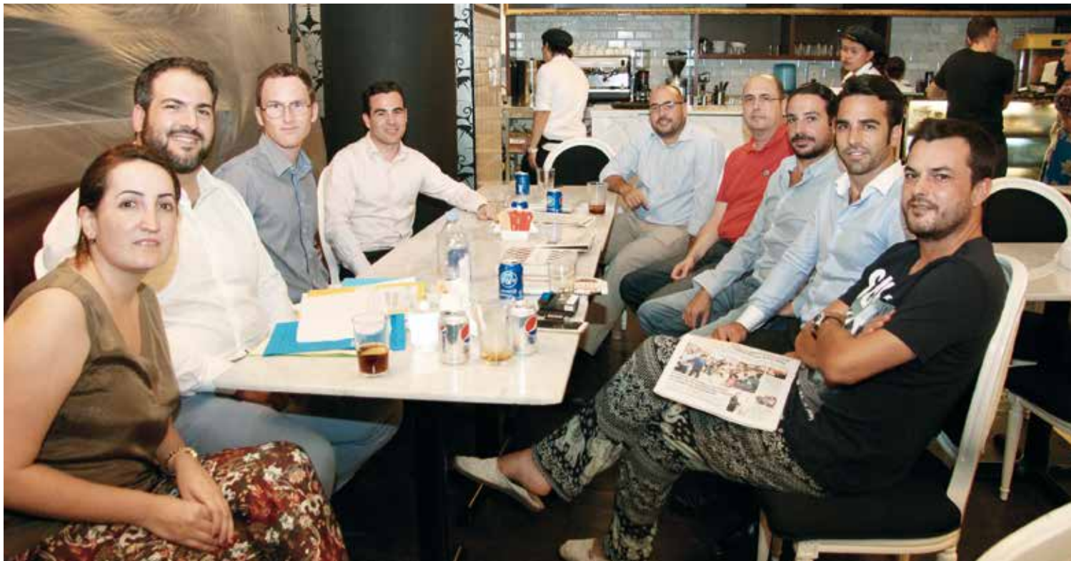
Asistentes a la primera reunión en Dubai del grupo de españoles que impulsa las candidaturas al Consejo de Residentes.