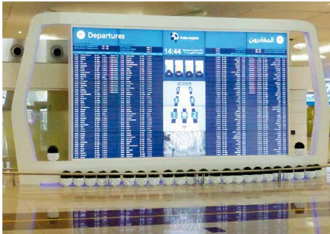
Panel de salidas en el Aeropuerto Internacional de Dubai.

Como elemento desencadenante del trance se encuentra la compli-