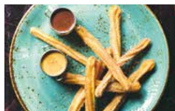
Tapas, paella y churros.