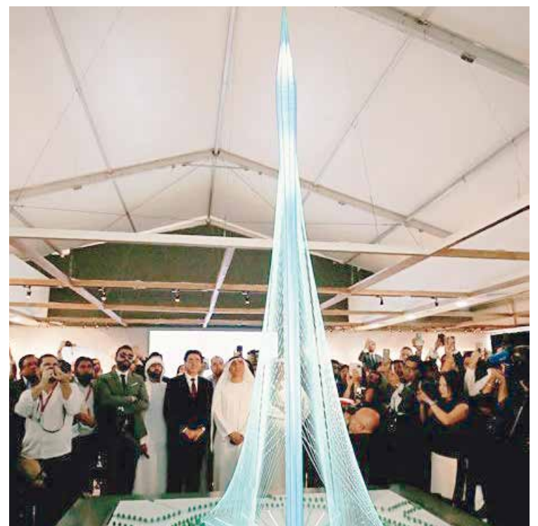
La maqueta de la nueva torre con Santiago Calatrava al fondo.

El proyecto de las obras del edificio ya está en marcha, tras la designación de la empresa Aurecon como responsable de ingeniería.