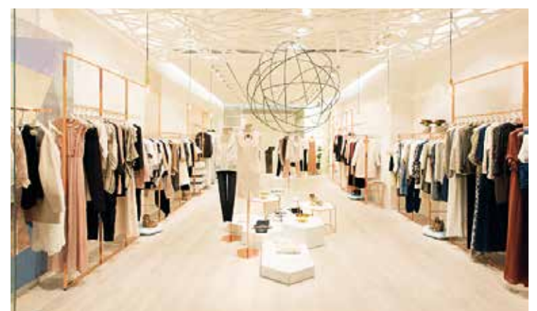
Tienda de la cadena Intropia.