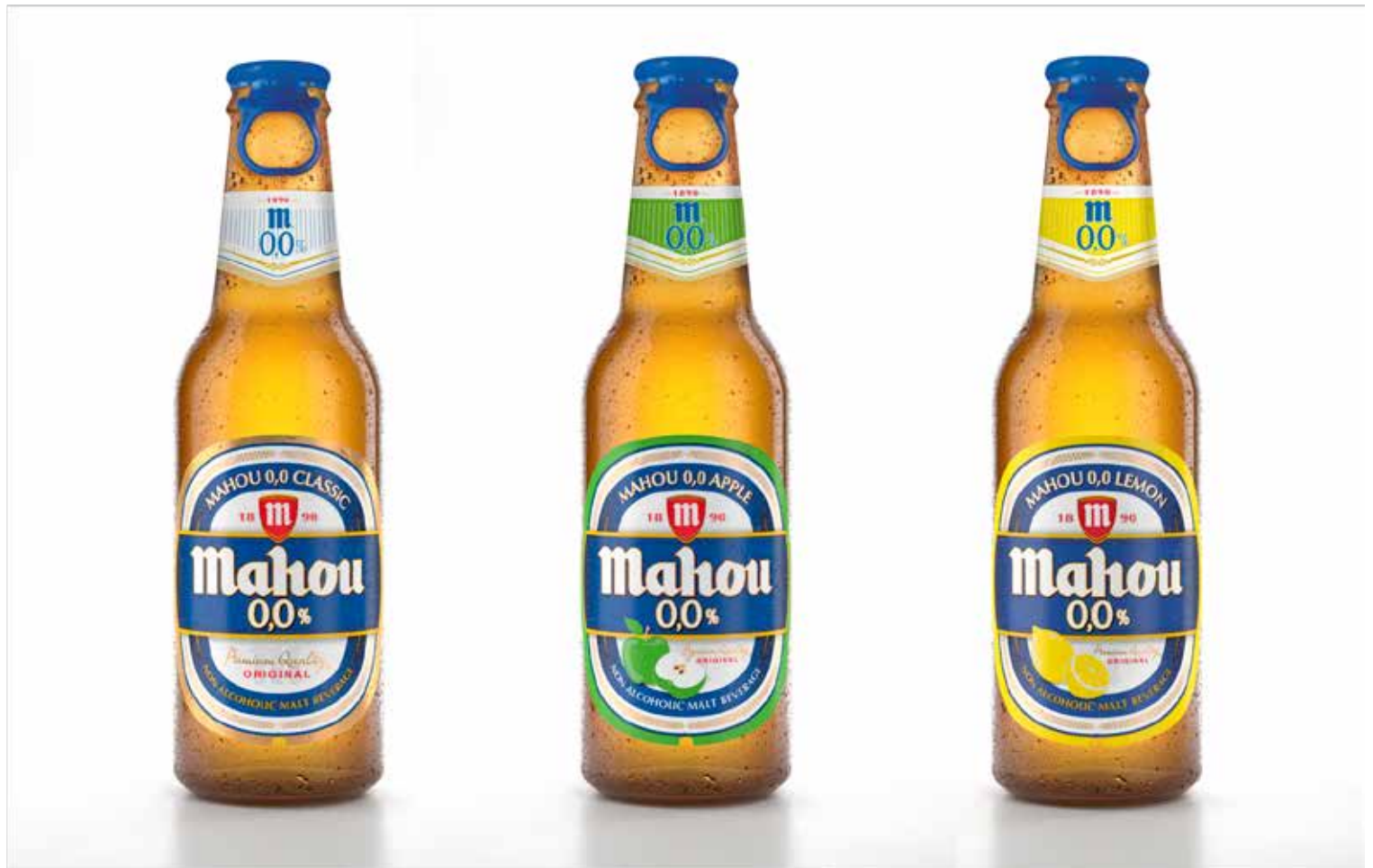
Mahou ofrece en Emiratos Árabes tres variedades 0,0, clásica, limón y manzana, elaboradas con ingredientes de máxima calidad.

Para los amantes del pescado, marisco y la comida, la cerveza puede ser también una gran compañía gracias a su ligereza y composición. El maridaje de la cerveza