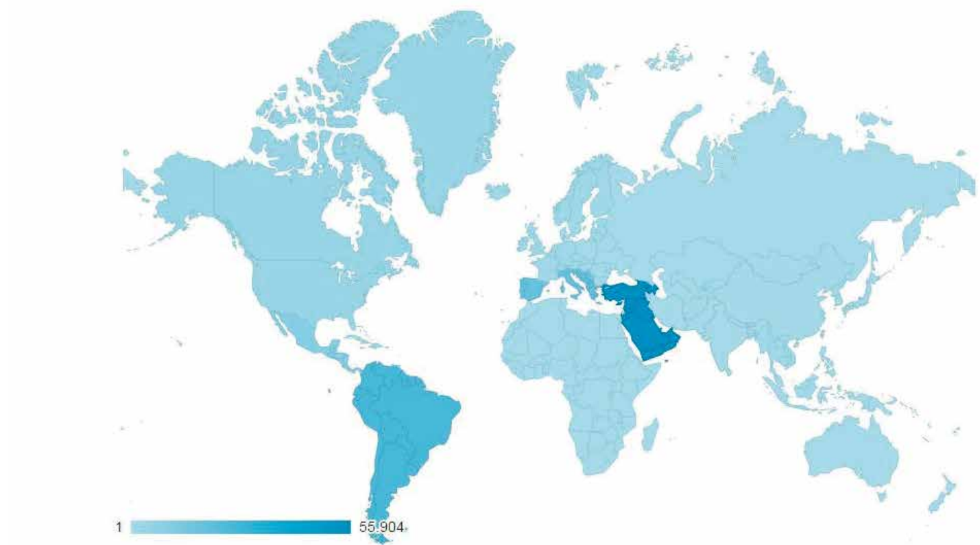
Mapa de la procedencia de las visitas que recibe la web de EL CORREO DEL GOLFO. GOOGLE ANALYTICS

Si el análisis se centra en los últimos treinta días se puede ver con claridad que la región del mundo que más lectores aporta a EL CORREO es la integrada por las zonas del Golfo y Oriente Próximo, seguidas de América del Sur, Europa del Sur, México y Centroamérica. En este periodo de treinta días