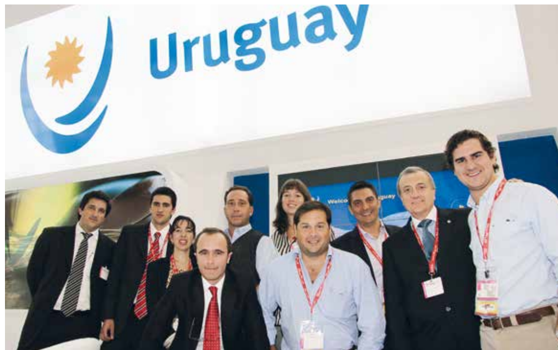
El embajador de Uruguay, Nelson Chabén—segundo por la derecha—, en el stand uruguayo en Gulfood.

El comercio bilateral entre Emiratos y Uruguay aumentó en el año