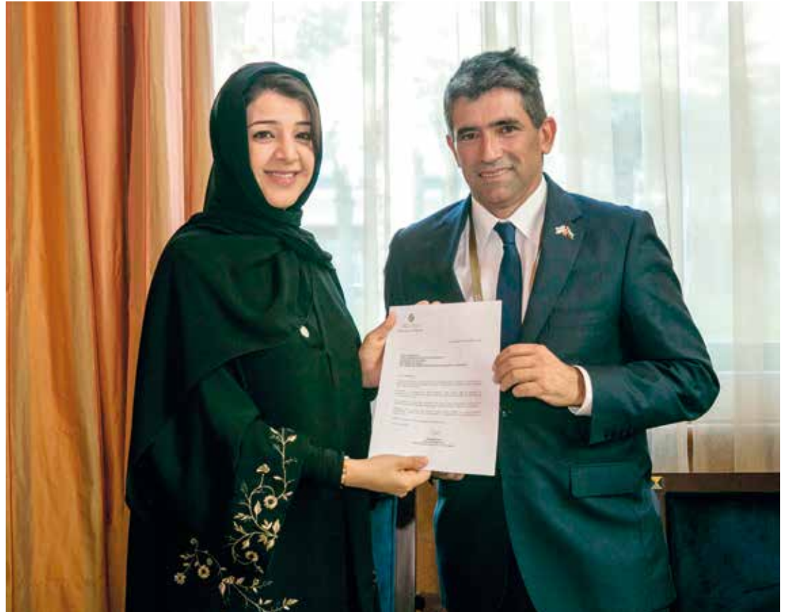
Reem Al Hashimi, ministra de Estado para la Cooperación Internacional y directora general de la Expo 2020, y Raúl Sendic, vicepresidente de Uruguay, en el momento de entrega del documento.

“Mercosur antes estaba más cerrado y hemos tomado acciones para que empiece a establecer acuerdos con la Unión Europea, más adelante hay que pensar en la posibilidad de un acuerdo con los países del Golfo”, puntualizó.