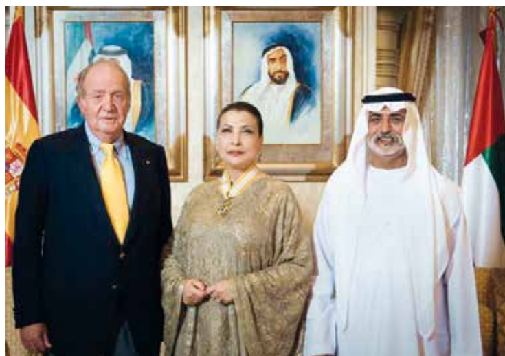
Juan Carlos I, con la condecorada, Hoda Al Khamis-Kanoo, y con el ministro de Cultura, el jeque Nahyan bin Mubarak Al Nahyan.

entre España y la comunidad internacional.