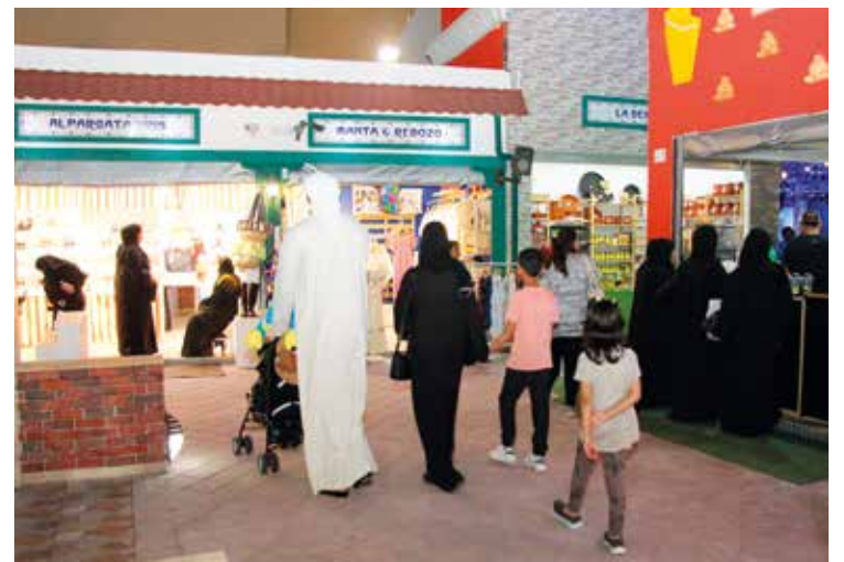
Los visitantes que recibe el Pabellón de España en Global Village son mayoritariamente locales o de la región del Golfo.

A ello se suman establecimientos de cosmética, joyería, souvenirs, trajes de gitana o abanicos. Y esta temporada también otros dedicados al turismo, a través de una agencia que organiza viajes personalizados a España, y hasta al arte con mayúsculas. Si busca algo de España, seguro que lo encuentra en Global Village. No tiene más que leer lo que viene a continuación.