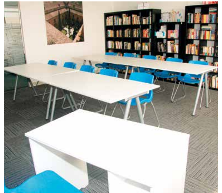
El equipo de la UCAM, en su nueva sede de Dubai, situada en JLT. A la derecha, una de las aulas disponibles en las modernas y amplias dependencias del centro educativo.