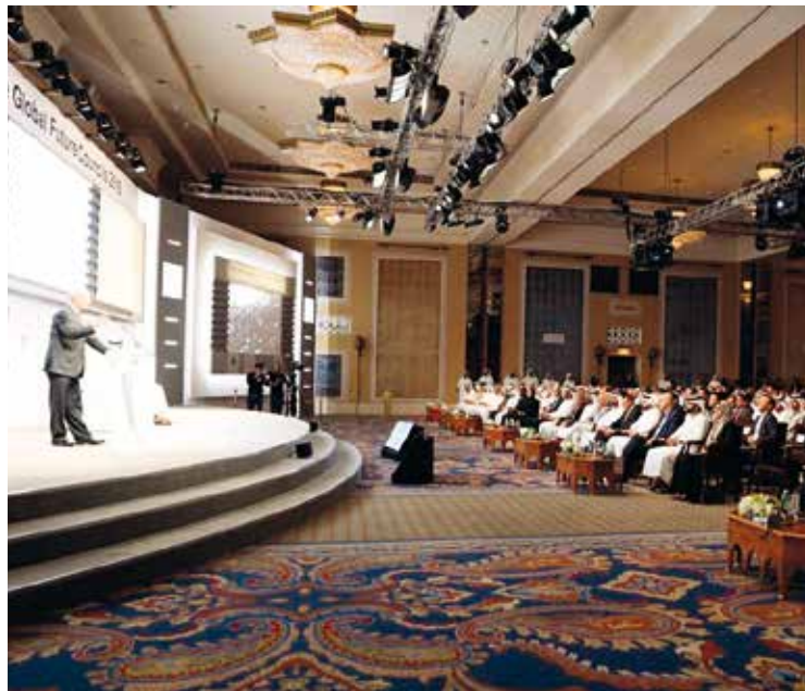
Inauguración del Consejo del Futuro Global en Dubai.

Además, considera que los conflictos políticos y militares que