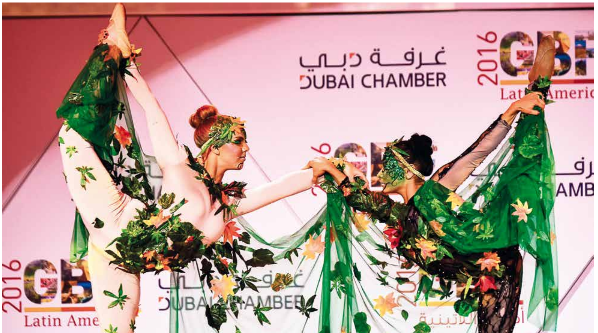
Un momento del espectáculo ofrecido por bnf en el Foro Empresarial Latinoamérica organizado por Dubai Chamber en noviembre en el hotel Atlantis. BNF