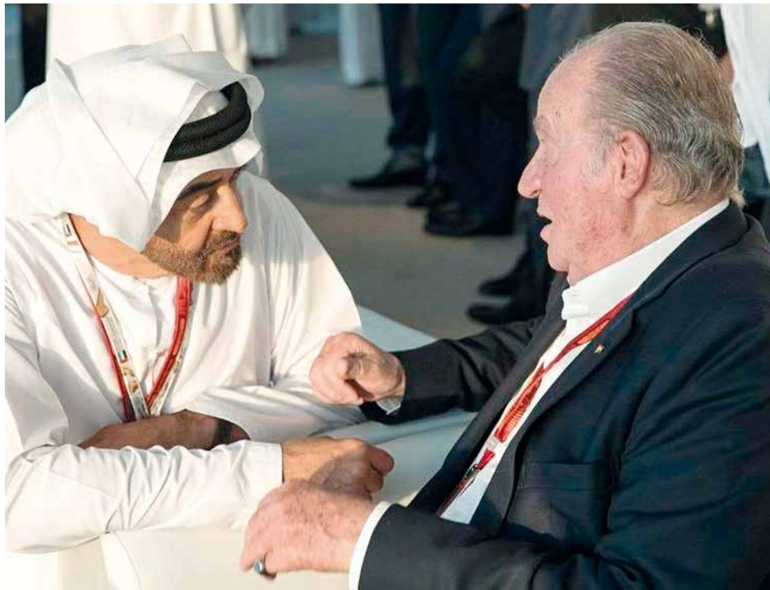
El príncipe heredero de Abu Dhabi y el Rey Juan Carlos I. CORTE DEL PRÍNCIPE HEREDERO

Su objetivo es reconocer los servicios que benefician al país y premiar comportamientos extraordinarios de carácter civil realizados por españoles y extranjeros que contribuyan a favorecer las relaciones de cooperación y amistad