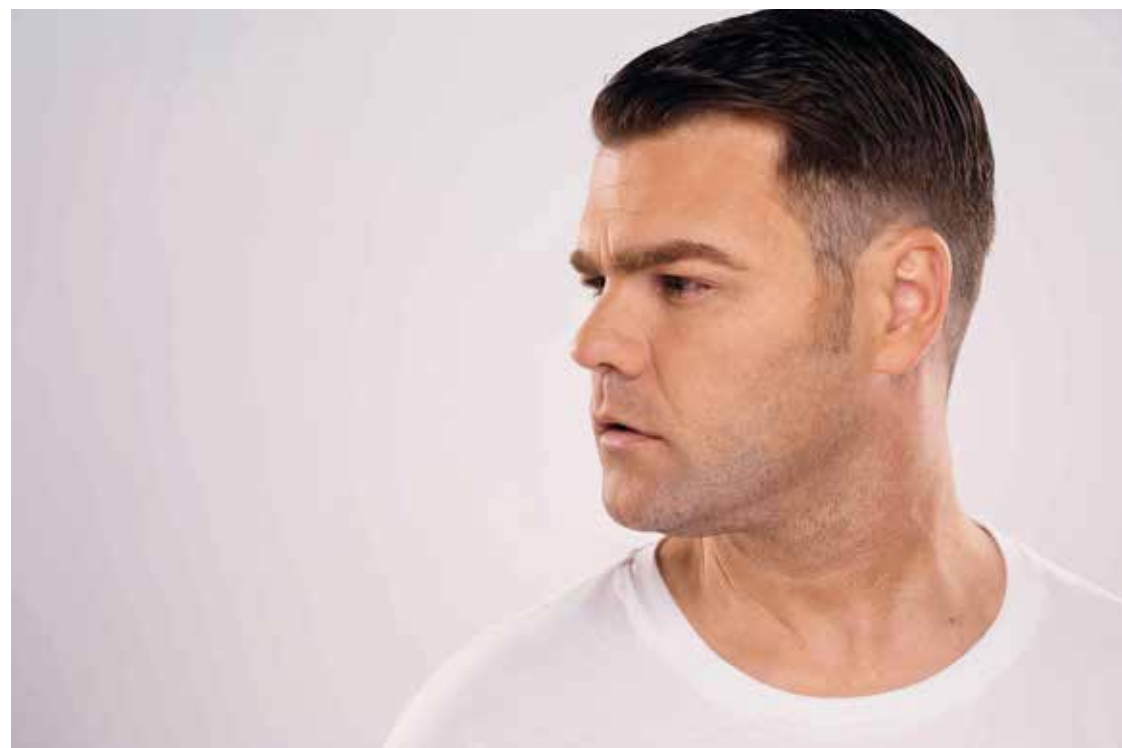
El dj español Fonsi Nieto será el protagonista de la gran noche que prepara Cielo Sky Lounge.

Cuando te retiras del deporte y más con una lesión, el poder tener otra cosa que te llene igual es muy importante. No fue fácil tener que