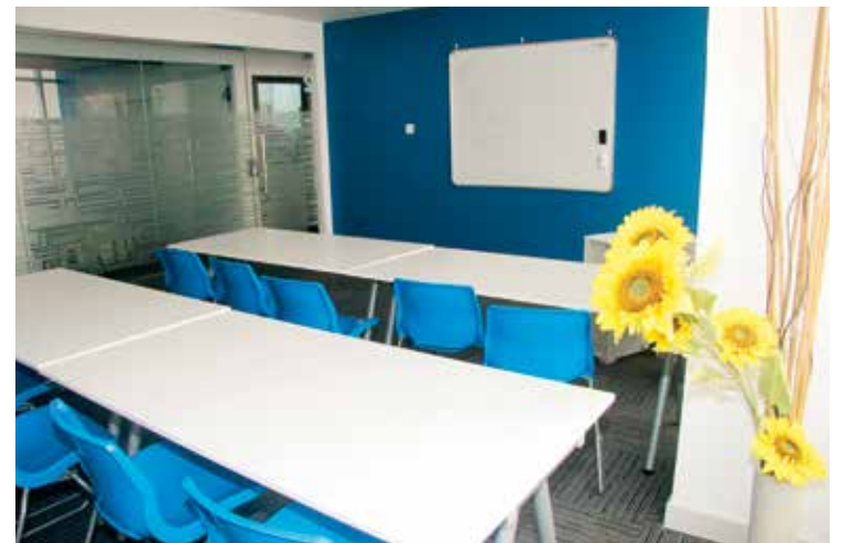
La nueva sede presenta espacios adecuados para cada actividad. E. C.

‘Modern Tongue Programme’. Impartido en Greenfield Community School y Raffles International.