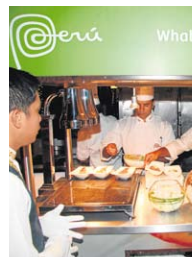
Las imágenes recogen distintos momentos de las actividades desarrolladas por los

Argentina y Ecuador han contado con la presencia de sus ministros de Asuntos Exteriores