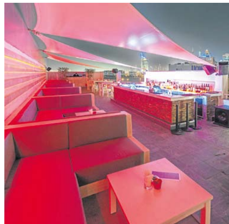
Story se ilumina sobre la noche de Dubai.