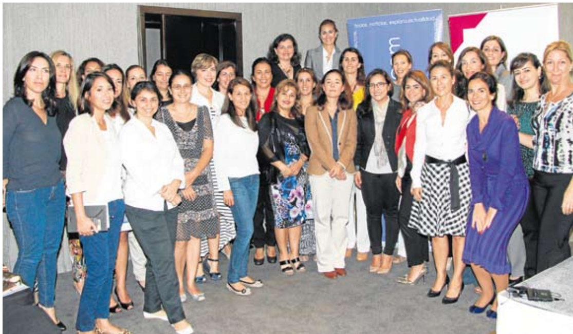
Foto de familia de las participantes en el encuentro con motivo del Día de la Mujer en Dubai.

El proyecto principal, el Premio Ro' Ya, es el resultado de una reciente iniciativa ofrecida de forma conjunta por Dubai Business Women Council y Master Card para promover el espíritu empre-