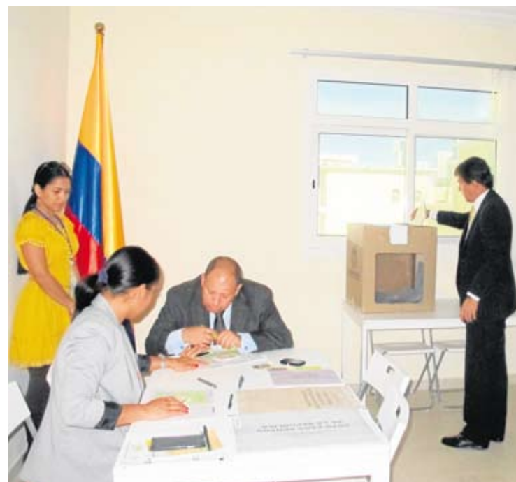
Votación en la Embajada de Colombia en Abu Dhabi.

Después de cada jornada los resultados han sido transmitidos a