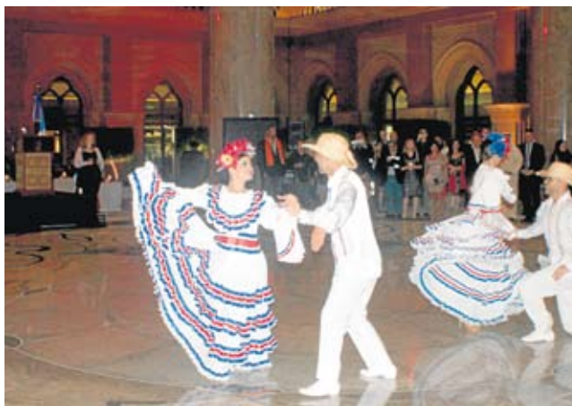
Folklore y rica gastronomía estuvieron presentes durante la celebración.