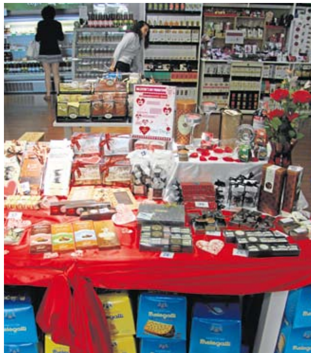
Distintas imágenes del complejo Barracuda Beach Resort y productos de la tienda Finer.

Quienes quieran disfrutar de un menú completo, con una de las mejores vistas de todo el emirato,