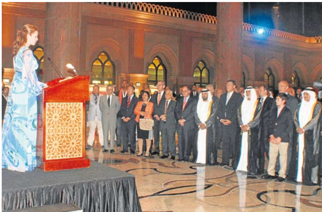
La embajadora, durante su intervención en el Día de la República Dominicana.

Amenizaron la velada el saxofonista dominicano Sandy Gabriel, que interpretó piezas del repertorio clásico de su país, y un grupo de merengue y bachata que hizo salir a la pista a más de una pareja. La cena servida en la celebración estuvo compuesta por elaborados platos típicos del país anfitrión.