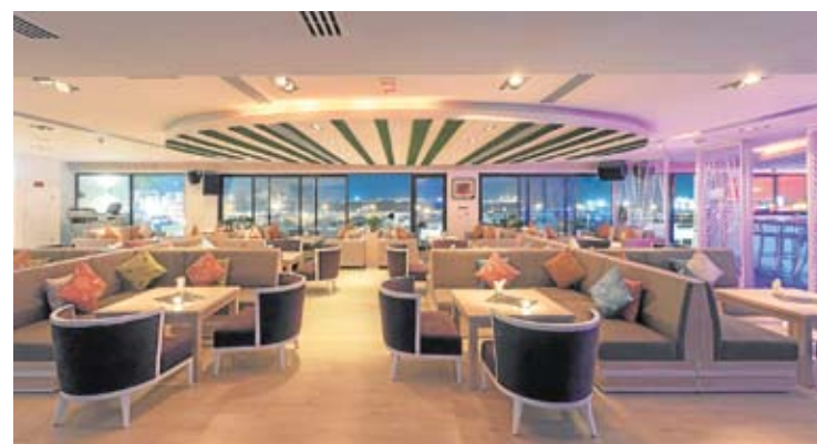
Acogedor interior de Story, amplio y cómodo.