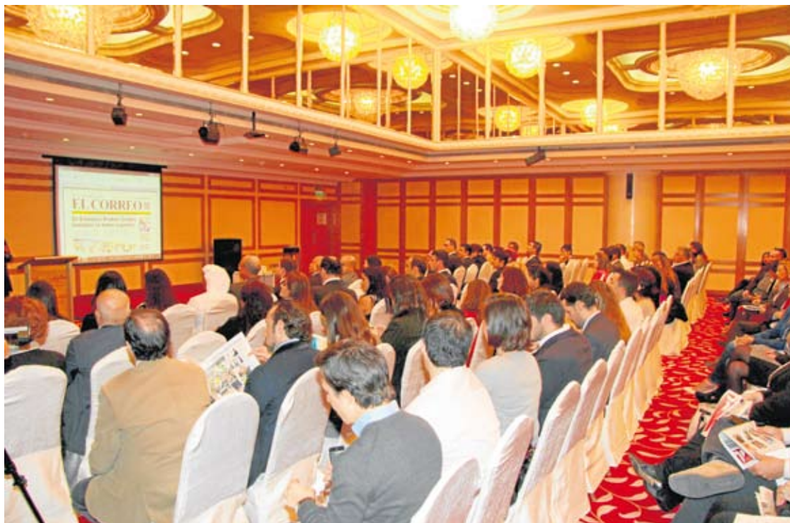
Aspecto de la lujosa sala del Hotel Crowne Plaza Abu Dhabi que acogió la presentación.