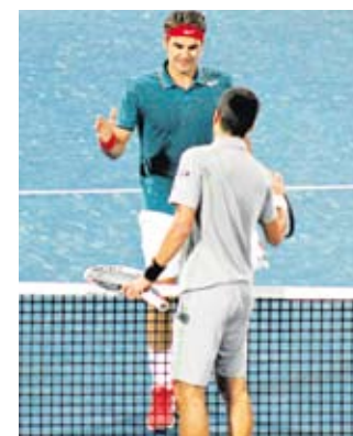
Djokovic felicita a Federer.

El brasileño, de 37 años, ganó con la selección brasileña siete copas de Sudamérica, tres copas de América, ocho ligas mundiales y tres campeonatos del mundo, además de una medalla de oro y dos de plata en Juegos Olímpicos.