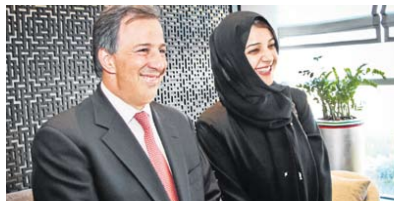
Su Alteza Sheikh Mohammed bin Rashid Al Maktoum obsequia el libro 'Destellos de conocimiento' a José Antonio Meade. El canciller de México también aparece con H.H. Sheikh Abdullah bin Zayed Al Nahyan, ministro de Asuntos Exteriores -arriba-, y con H.E. Reem Al Hashimy, ministra de Estado.

GIRA POR EL GOLFO ARÁBIGO IMPULSO A LAS RELACIONES BILATERALES Y A LOS INTERCAMBIOS ECONÓMICOS Y CULTURALES