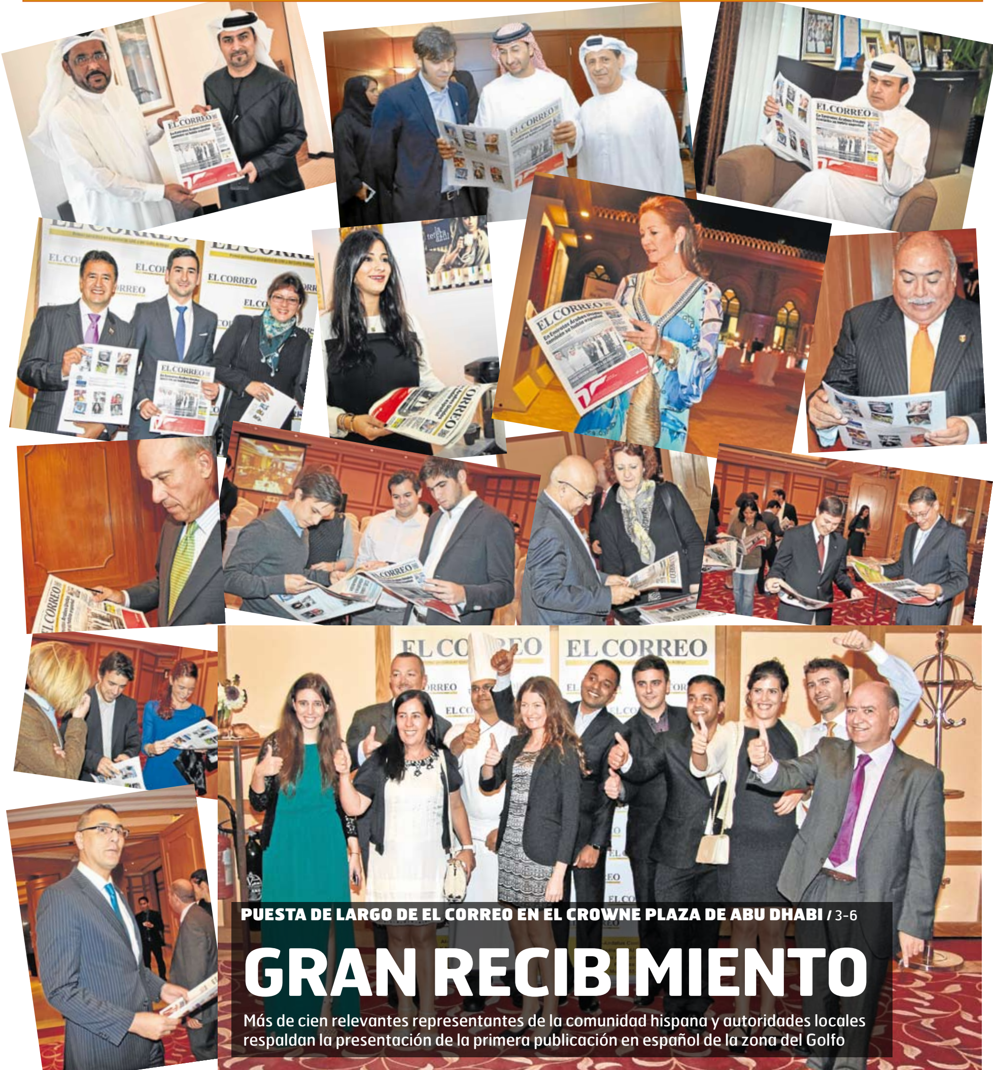
PUESTA DE LARGO DE EL CORREO EN EL CROWNE PLAZA DE ABU DHABI / 3-6

Primer periódico en español de UAE y del Golfo Árabe