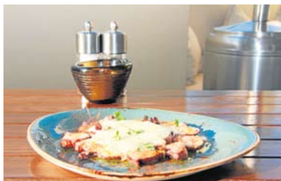
Pulpo a la gallega con espuma de patatas.