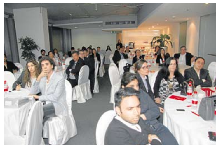
Asistentes al primer Foro Inmobiliario Español.

El primer Foro ha contado con la presencia de más de 70 personas entre las que se encontraban inversores individuales, agencias inmobiliarias, consultores jurídicos e instituciones bancarias líderes en el mercado inmobiliario en España.